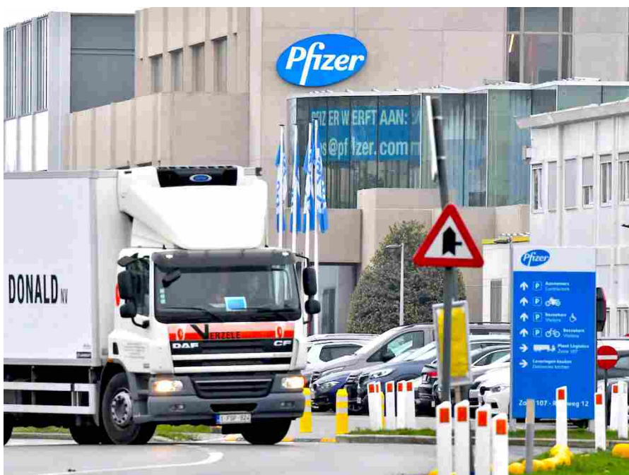
lo stabilimento di produzione della Pfizer, in Belgio, da dove partiranno anche i vaccini destinati all'Italia